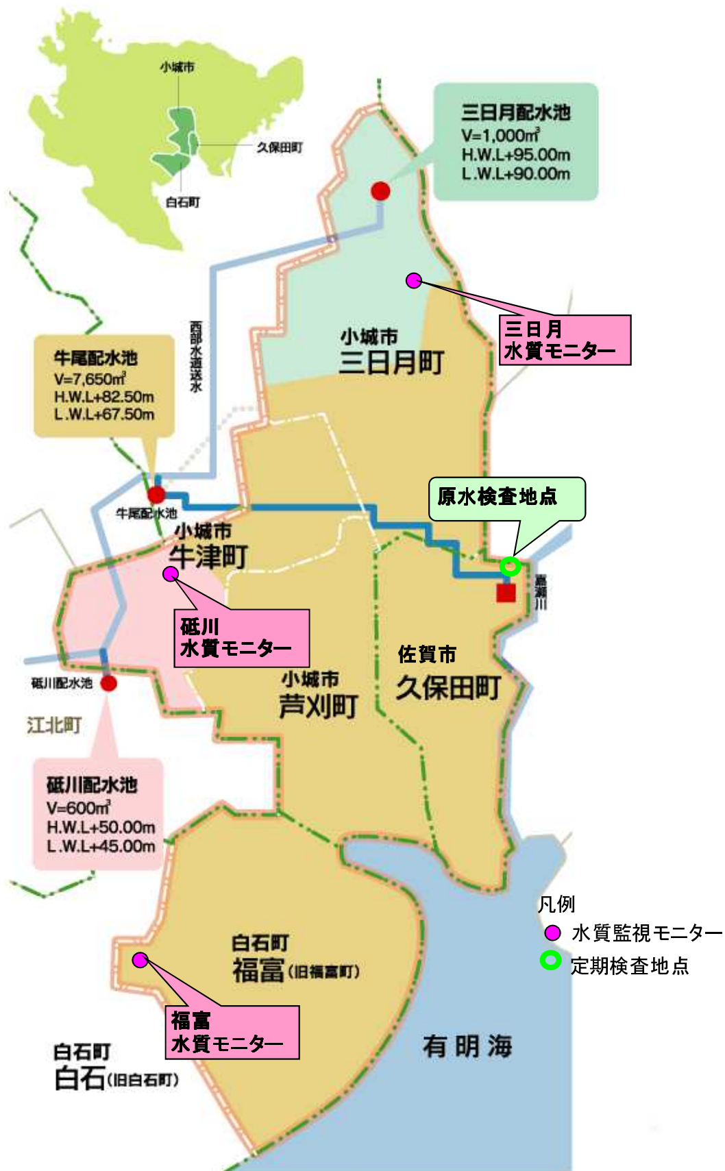
定期検査地点および水質監視モニター(計器)配置図