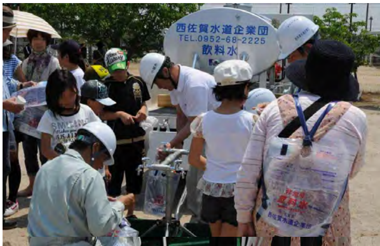
住民への給水袋使用方法の説明風景